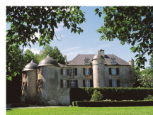
CHÂTEAU D'URTUBIE Urrugne EN SAVOIR PLUS