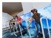
CITÉ DE L'OcéAN Biarritz EN SAVOIR PLUS