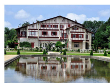
VILLA ARNAGA Cambo-les-Bains EN SAVOIR PLUS