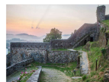
CITADELLE VAUBAN Saint-Jean-Pied-de-Port EN SAVOIR PLUS