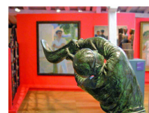
MUSÉE BASQUE Bayonne EN SAVOIR PLUS