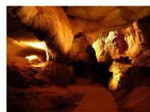
GROTTES DE SARE Sare EN SAVOIR PLUS